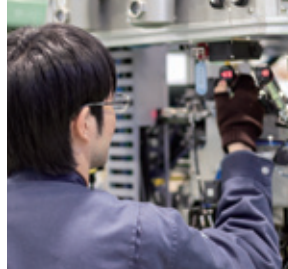
社員一人ひとりの高い技術力が当社の強み