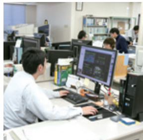
若手とベテランが活躍している設計部門