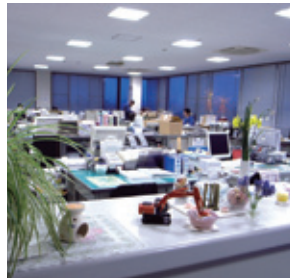
円滑なコミュニケーションがとれる社内