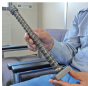
特殊な加工技術でニーズに応える